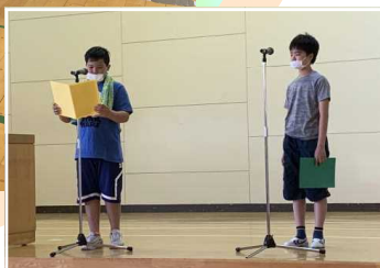
↑ 始業式でもソーシャルディスタンスを保って、お話を耳を傾けます。