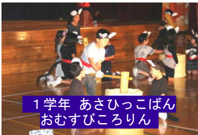
1学年 あさひっこばん おむすびころりん