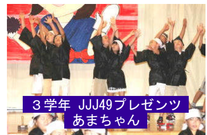
3学年 JJJ49プレゼント あまちゃん

学芸会は、本校が行う教育活動の成果を広く保護者や地域の皆様にご覧いただける大切な場の一つです。