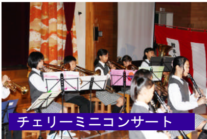
チェリーミニコンサート