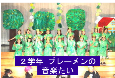
2学年 プレーメンの 音楽たい

一般公開日の来校者をお願いした「当日アンケート」や事前に配付して当日までの頑張りや実施後の様子も評価いた