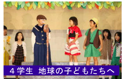
4学生 地球の子どもたちへ

本校では、「日常の学習の成果を総合的に発表することにより、伸び伸びと表現する能力を養うとともに、協力してよりよいものを作り出す喜びを味わわせる。」「役割分担や係分担の主体的な活動を通して、計画性や協力性、責任感を養う。」ことを学芸会のねらいとして、9月24日(火)からは特別時間割を組んで準備、片付け、反省に取り組みさせてきました。