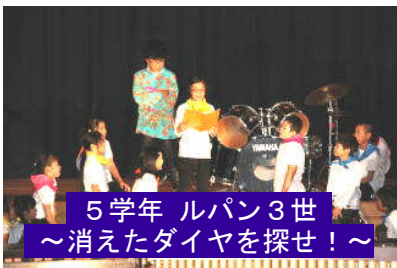
5学年 ルパン3世 ～消えたダイヤを探せ!～

学芸会は、本校が行う教育活動の成果を広く保護者や地域の皆様にご覧いただける大切な場の一つです。