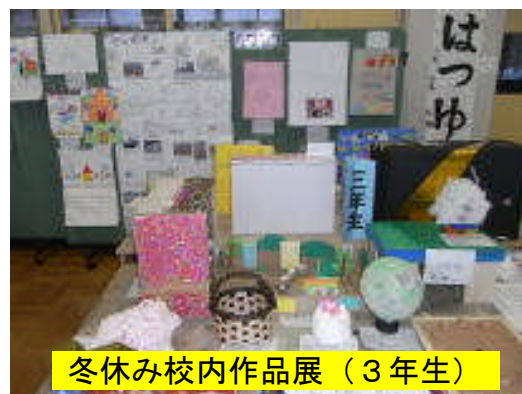
冬休み校内作品展(3年生)

特に登校時における子どもたちの安全確保を確実なものとするためには、多くの目が届く時間帯で行動させることが大切です。児童単独での登校時間ができるだけ少なくなるよう、家を出る時刻について、引き続き各ご家庭でのお子様への指導をお願いいたします。