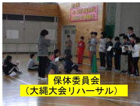
保体委員会 (大縄大会リハーサル)