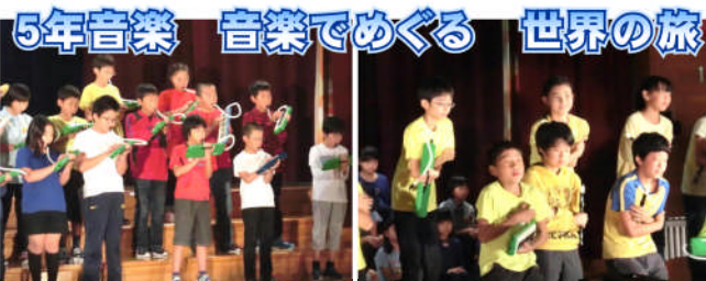
5年音楽 音楽でめぐる世界の旅