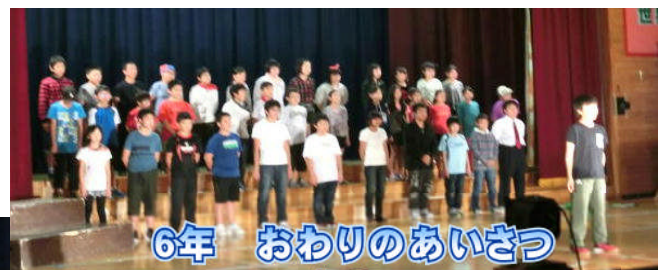
6年 おわりのあいさつ