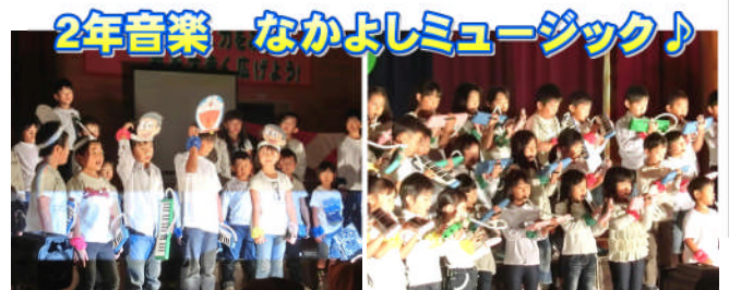
2年音楽 なかよしミュージック♪