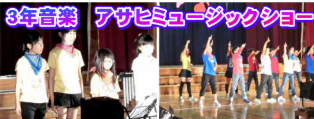
3年音楽 アサヒミュージックショー