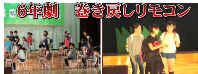
6年劇 巻き戻しリモコン