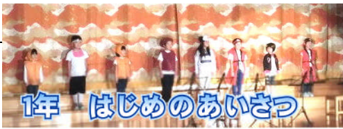
1年 はじめのあいさつ