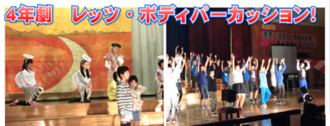
4年劇 レッツ・ボディパーカッション!