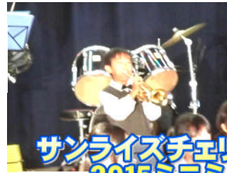
サンライズチェリーオーケストラ 2015ミニミニコンサート