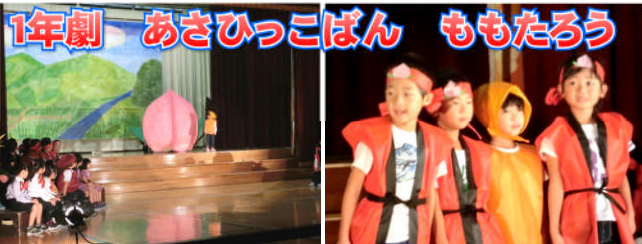
1年劇 あさひっこばん ももたろう