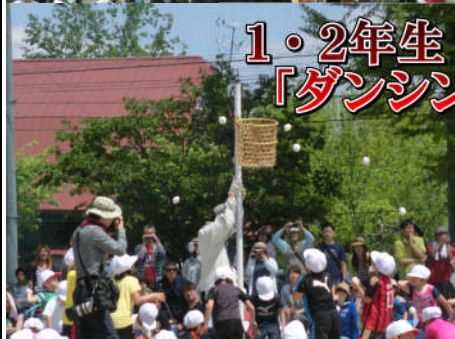
1・2年生 「ダンシング玉入れ」