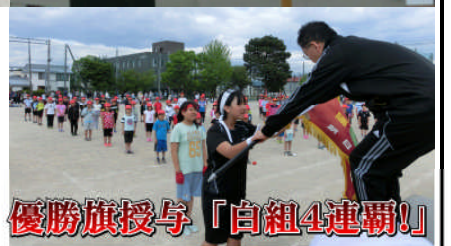
優勝旗授与「白組4連覇!」

午前中の競技で白組が優位となり、大きな得点差がついてしまいました。けれども、午後の部では赤組の猛反撃。団体戦は午後全て赤組が勝利し、さて最終結果は…。10点差で白組の4連覇となりました。勝っても、負けても朝日っ子たちの表情には、最後まで全力でやり遂げた気持ちよさそうな笑顔があふれていました。