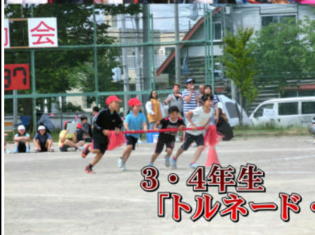
3・4年生 「トルネード・ハリケーン」