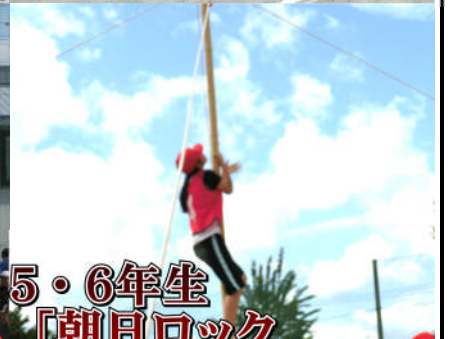
5・6年生 「朝日ロック クライミング 2016」