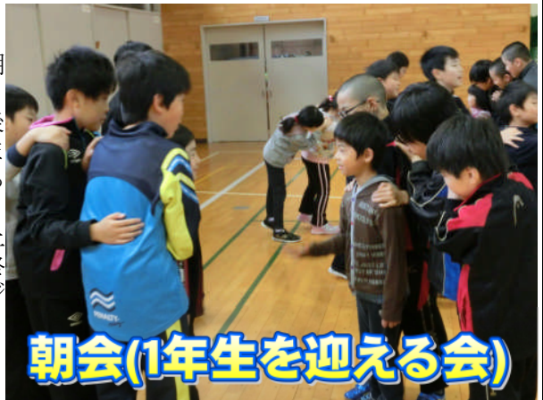
朝会(1年生を迎える会)

4月は、学校のルールに慣れるため、たくさん先生や上級生のお話を聞くことが多かったと思います。運動会を終えて、一回り立派になった1年生は、整列も行進も、ラジオ体操も上手になりました。お話を聞く姿勢も立派です。これからは、上級生にたくさん質問をしたり、話かけたりしてほしいと思います。