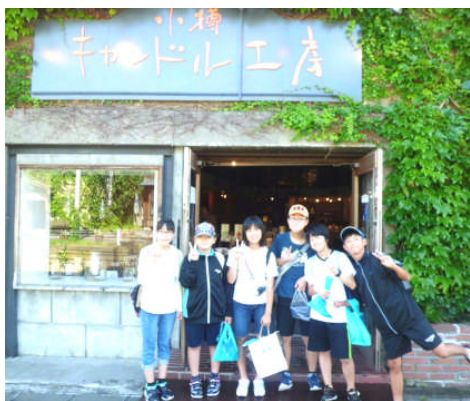
【小樽キャンドル工房前】