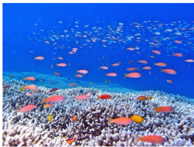
沖縄県のさんご礁