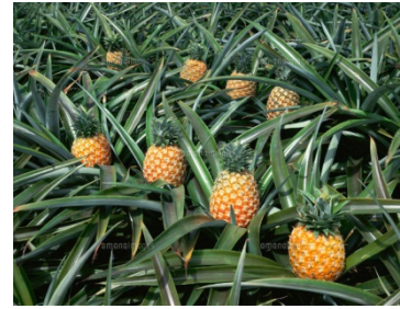
沖縄県のパイナップル畑