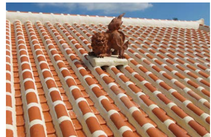
沖縄県の漆喰の瓦屋根