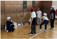
ダンス動画で練習