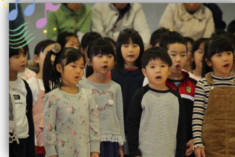
1年生『きょうもあしたも1年生』