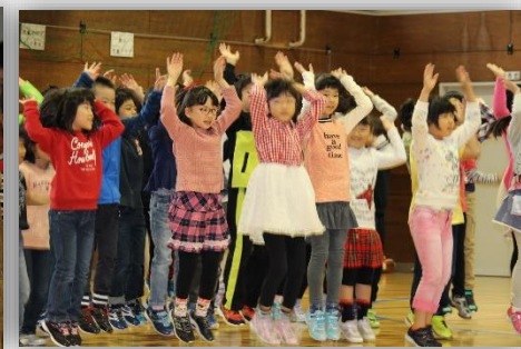
2年生『ミッキー・マウス・マーチ』