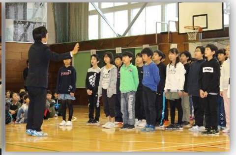
6年生『We' ll find the way』

2校時目は、各教室で授業を参観いただきました。少し緊張した様子も見られましたが、いつものはりきって学習する子どもたちの姿が見られました。