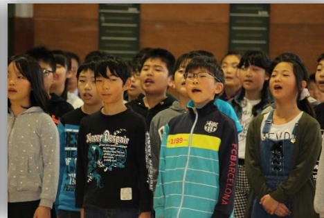
5年生『ハッピー・メロディー』