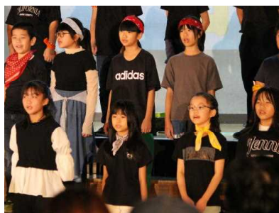
5年 虹（カラフル）な音楽会