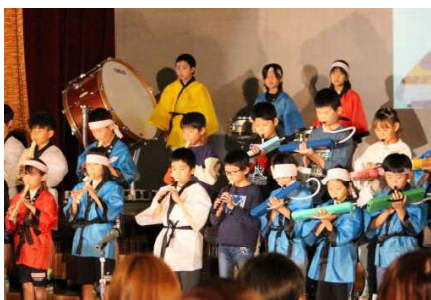
4年 夕焼け超特急に乗って ～音楽・踊りの旅～