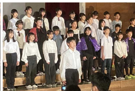
6年 Air -ある日の帰りみち-