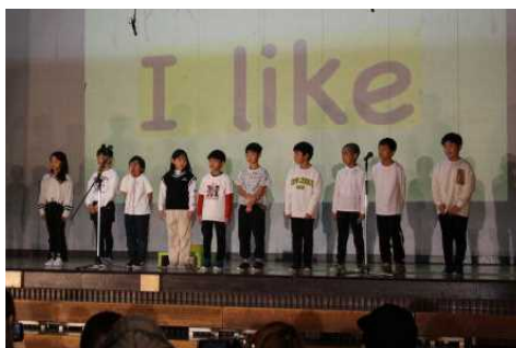
3年 スーパーお日さま 3年生！