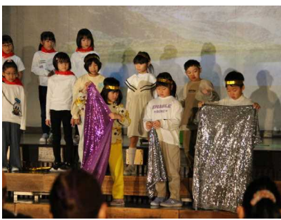
2年 小さな小さなまほうつかいの 大きな大きなぼうけんの話