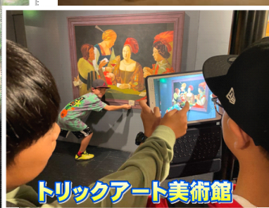
トリックアート美術館