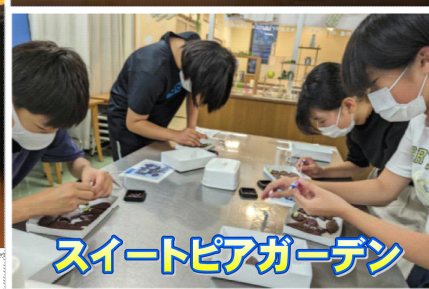
スイートピアガーデン