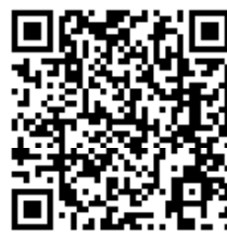
緊急連絡フォームQRコード