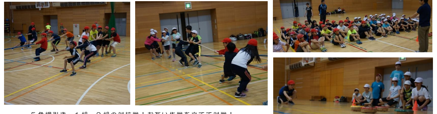
5色綱引き～1組・2組の対抗戦！お互い作戦を立てて対戦！

2日目のメイン活動は「スポーツレク」「フロアカーリング」でした。「スポーツレク」では、5色綱引きとドッジボールを行いました。5色綱引きは5色の綱のうち3本以上の綱を自陣へ引き込むと勝ちというものです。1組と2組が対戦しましたが、勝負の前には作戦を立て、誰がどの綱を引くか相談します。お互い駆け引きをしながら、最後の1本まで力強く綱を引き合い熱戦が繰り広げられました。