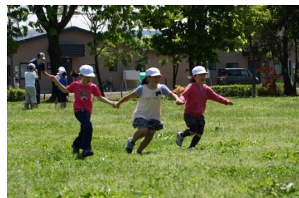
2年生 みんなで手つなぎおに