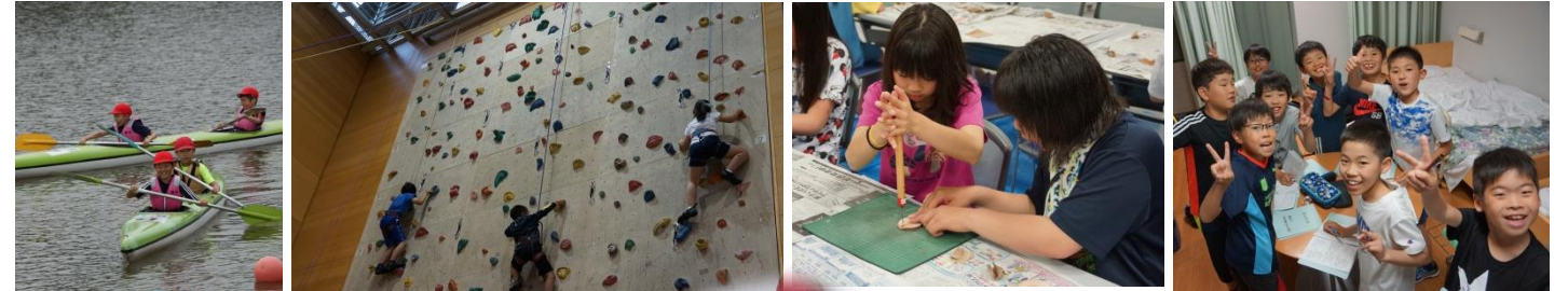
いろいろな形をしたホールド（擬石） 自分でホールドを選んで進みます。

6月11・12日の2日間、5年生の子どもたちが楽しみにしていた宿泊研修を実施しました。宿泊先は、深川のネイパル深川です。研修初日のプログラムは、「カヌー・ローボート体験」「室内ウォークラリー」「スポーツクライミング」「木のキーホルダーづくり」と就寝時刻の午後10時まで活動が続きしました。