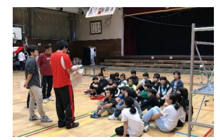
各係活動の取組（前日準備）