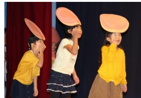
1年「にげだしたホットケーキ」

各学年の演目は、劇や歌、ダンスに器楽演奏など、バラエティーに富み、どの発表も子どもたち一人一人の頑張りがありました。また、5・6年生は演目ばかりでなく、係活動にも取り組み、縁の下の力となって学習発表会を支えました。