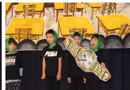
2年「どろぼう がっこう」