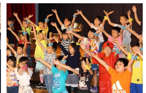
3年「世界の国からこんにちは」