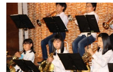
吹奏楽「Atago Smile Brass 2018」