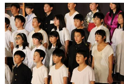
6年「おわりのことば」

学校では、大きな行事が終わり、これからじっくりと学習に取り組むことができる時期になります。この学習発表会で得た貴重な経験を、今後の学校生活に生かし、さらなる成長へとつなげていきます。保護者の皆様には、衣装や道具の用意、児童への励まし、当日の観覧等々、さまざまなお協力を賜り、本当にありがとうございました。