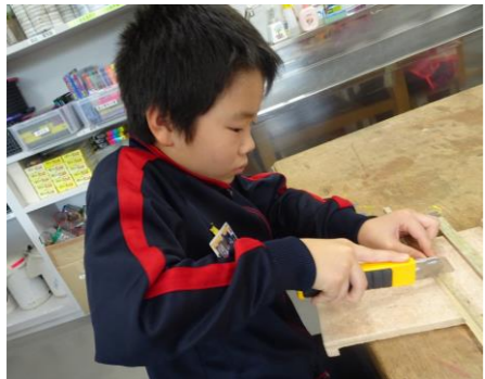
何を制作しているでしょう?