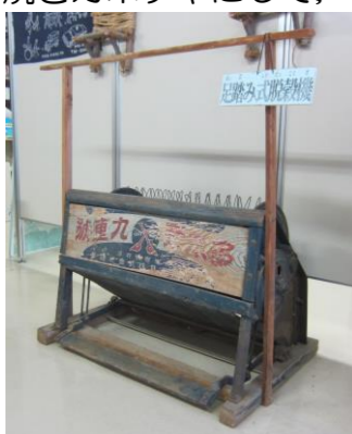
郷土資料室の脱穀機

秋と言えば『収穫の秋』もあります。5月から取り組んだ「学級園」。ミニトマトやキュウリ、メロンなどその季節毎に育てた食物を収穫し味わいました。この間は、ジャガイモやカボチャを収穫しました。そして、「秋の突哨山活動」に合わせて、突哨山での学習終了後、その場で焼き芋や焼きカボチャにして、秋の恵みを味わいました。私も同行してましたので、お裾分けしてもらいました。