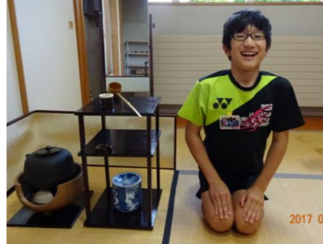
伝統文化 茶道体験

9月13日(水)~14日(木)に5・6年生が宿泊研修で道立青少年体験支援施設「ネパール深川」に行ってきました。天候不順にもめげずに、室内ウォークラリー、茶道体験、スポーツライミング、スポーツ交流などなど…協力して有意義な学習をしてきました。他団体と気持ちよく過ごすための挨拶やマナーなどの公共の場での過ごし方も学習の一環でした。数々の体験を通して、自分たちで時間管理して過ごすことや協力することなど、想い出多い一泊でした。帰校した時は、また一つ大人の顔つきになった高学年の子たちでした。