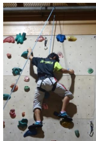
スポーツライミング! 登る! 登る! 校長先生も登る!!

9月13日(水)~14日(木)に5・6年生が宿泊研修で道立青少年体験支援施設「ネパール深川」に行ってきました。天候不順にもめげずに、室内ウォークラリー、茶道体験、スポーツライミング、スポーツ交流などなど…協力して有意義な学習をしてきました。他団体と気持ちよく過ごすための挨拶やマナーなどの公共の場での過ごし方も学習の一環でした。数々の体験を通して、自分たちで時間管理して過ごすことや協力することなど、想い出多い一泊でした。帰校した時は、また一つ大人の顔つきになった高学年の子たちでした。