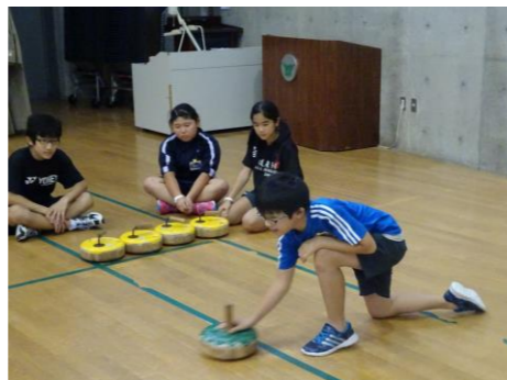
楽しいフロアカーリング