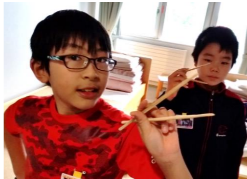
Eco My 箸!!