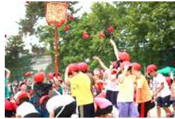
低学年五入れの様子

『皐月の空に 風おかり にれの木かげで 運動会』(知新小 応援歌より)第50回知新小学校の運動会が暑い日差しのもと盛大に行われました。急激な気温上昇により、午後の部のプログラムを変更するほどの暑さの中、頑張る子どもたちを最後まで応援して下さりありがとうございます。