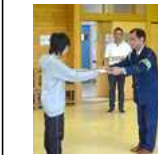
委嘱状の受け取り

昨今、児童生徒が巻き込まれた痛ましい交通事故の様子が、TV等で報道されています。知新っ子の子どもたちが交通事故による犠牲者とならないためにも、交通ルールを守り、常に安全に配慮した行動をとってほしいと思います。