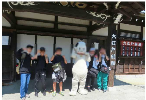
修学旅行：伊達時代村にて

なお、学校で配付しました「夏休みの生活」を活用してお子さんと生活の約束をするなど、安全で安心な夏休みを過ごせるようお子さんへのご指導、よろしくお願いいたします。