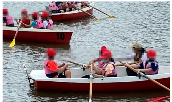
宿泊研修：カヌー・ボート体験