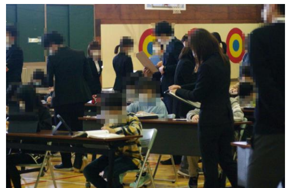
教員が子どもの学習を参観している様子

学校だより第9号で、本校の学力向上策を紹介しましたが、本校教職員で共通理解を図り、日々研修を重ねていく中で、組織的に学力向上を図っています。2月9日（木）には、本校だけではなく、近隣の小学校の教員と共に今求められている授業の在り方について研修を図り、研修の内容を生かしながら、子どもたちの学力向上を図っているところです。