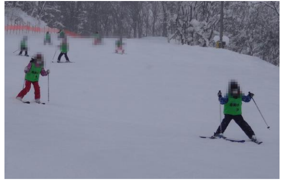
3年生がスキーをしている様子

保護者の皆さまにおかれましては、スキー用具の準備やリフト代、バス代の納入等、ご負担をおかけいたしました。誠にありがとうございました。