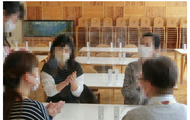
グループセッションをしている様子