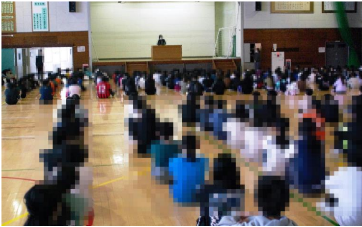
体育館での朝会の様子

2年生は、初めての体験でしたが、校長先生の話にしっかりと耳を傾けるなど、上の学年をお手本にしながら朝会に参加することができました。