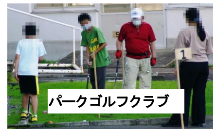
パークゴルフクラブ

なお、3学期はスキー学習を予定しています。子供たちが安全にスキーを楽しめるように、スキー学習支援ボランティアのご協力をお願いしたいと考えています。次の日程でスキー学習を行う予定ですので、指導員もしくは準指導員の資格をお持ちで、学習支援をしていただける皆様は、別紙「スキー学習支援ボランティア申込書」をお読みいただき、申込みをよろしくお願いいたします。