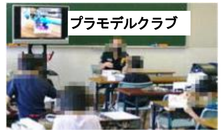
プラモデルクラブ

「おはなしの会」の皆様による読み聞かせは、1年間を通して計画的に行われています。感染症対策により放送室からテレビを通じて読み聞かせをすることもありますが、子供たちは話の内容に興味をもって耳を傾けています。