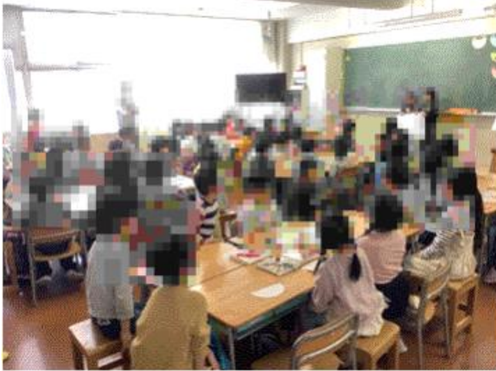
1年生教室での交流の様子