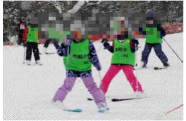
3年生がスキーをしている様子

保護者の皆さまにおかれましては、スキー用具の準備やリフト代、バス代の納入等、ご負担をおかけいたしました。誠にありがとうございました。