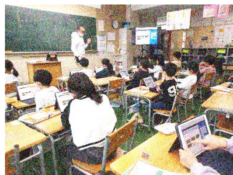
1 年 算数「大きなかず」(1/19)

現行学習指導要領では、「学習の基盤となる資質能力」の一つとして「情報活用能力」があげられています。この「情報活用能力」の内容は、①情報活用の実践力（検索や調べ学習等の問題解決、プレゼンテーション）②情報の科学的な理解（プログラミング、AI やインターネット等に関する理解）③情報社会に参画する態度（情報モラル、情報の真偽の判断等）に大きく分けられます。小学校では各教科で、中学校では技術・家庭科を中心として、高校では情報科を中心として、発達段階に応じ「情報活用能力」の育成を目指していきます。