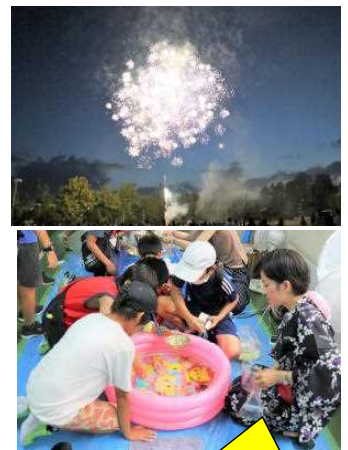
東町小ではPTA主催による夏祭りが4年ぶりに開催できました。