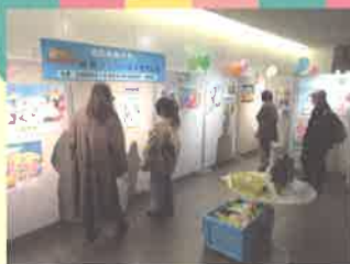
▲ 絵画コンクール入賞作品展（チカホ）