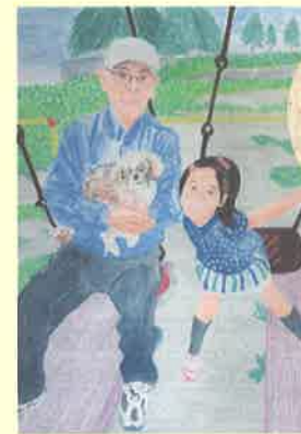
『もう一度戻りたいな』