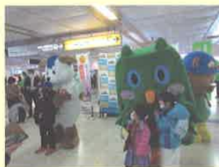
▲ JR札幌駅での街頭啓発活動