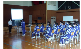
スマホ・安全教室