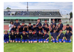
校内陸上競技大会