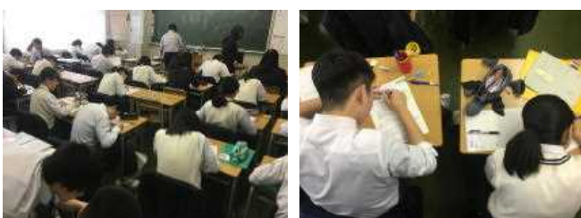
<誇りと責任をもって自分の進む道を切り拓く受験生>