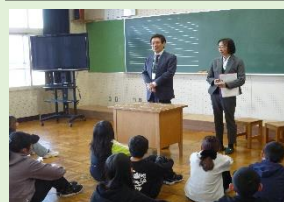
5年生 人権擁護カード贈呈会