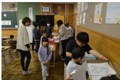
6年生が1年生のお世話をしています