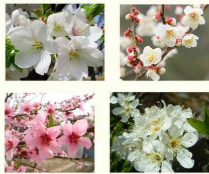
上左から 桜 梅 桃 李 (花のサイズはランダム)

「桜梅桃李(おうばいとより)」という言葉があります。「それぞれ違った色や形の美しい花を咲かせるように、子どもたち一人一人の個性を尊重する」という教育の願いが込められています。他人と自分を比べたり他人と同じになったりする必要はなく、自分にしかない個性を磨いたり長所を伸ばしたりしていくという意味です。歌「世界で一つだけの花」を思わせるような言葉だと思います。