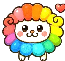
あおぞら児童会 いじめ防止キャラクター ふわりん

児童会本部役員が玄関ホールに立って始めたあいさつ運動。現在は、担当する学級を入れ替えながら、全校のみんなを笑顔で迎えています。