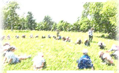
2年「クリスタルパーク」