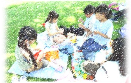
4年「カムイの杜公園」