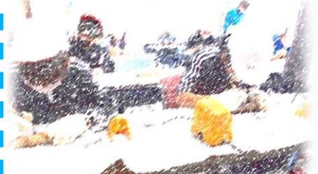
「マイスプーン作り」

クラフト工作(マイスプーン作り)やハイキング(流れた溶岩によって作られた地形を見学)等、学校内では学ぶことが難しい貴重な体験をした子どもたちにとって、大変有意義な時間となりました。