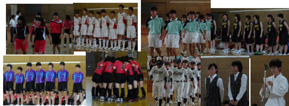
(写真は壮行会の一コマ)

今年度は当番校業務のため全校応援ができませんでしたが、どの試合会場でも多くの保護者の皆様が熱い声援を送って下さっていました。