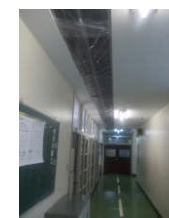
←給食室前廊下の天井の様子

校舎内の水道管を全て新しくするため、特別教室や廊下の天井裏に張り巡らされている古い水道管を撤去し、新しい水道管を設置している所です。