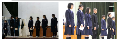
【生徒会本部役員】 【学級役員】

10月9日（水）に、後期生徒会役員・学級役員の認証式が行われました。後期の生徒会役員は、立候補者が定数であったため、無投票当選となりました。後期は2年生が中心となった活動になります。先輩方から学んだことを生かし、新たなことに挑戦するなど、リーダーシップを発揮して活躍することを期待しています。前期の生徒会の皆さん、3年生を中心に「さすが、学校のリーダー」という活躍でした。