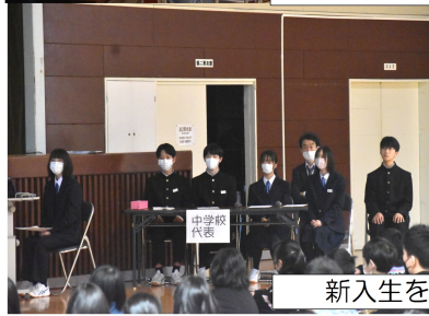
新入生を迎える会