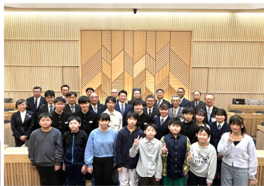
今津市長を囲み記念撮影