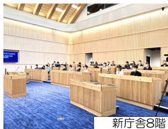
新庁舎8階 市議会議場

2月17日(土)、「旭川市子ども議会」が開催されました。子ども議員の参加資格は、市内小学校5年生から中学3年生となっており、本校も生徒会役員を中心に5名が参加しました(計17名)。参加生徒は11月末から計4回の事前協議会に参加し、議会での質問事項等を練り上げ、当日は市長を始め関係部局に質問・提案を行いました。※当日の質問要旨(下)