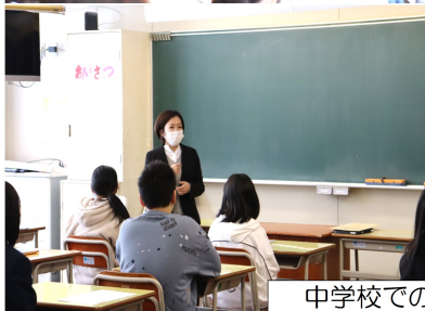
中学校での授業体験会