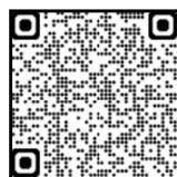
よくわかる啓北中