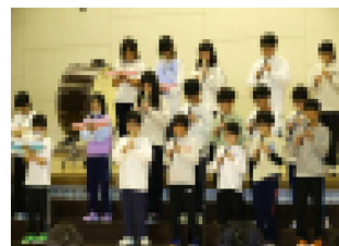
<5年 啓明ステーション>