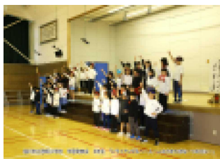
<3年 トライアングル>