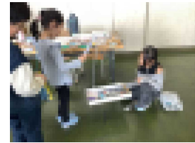
【1年生と2年生の交流の様子】