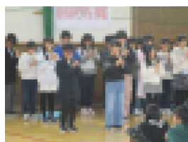
【5年生の「ありがとう」の様子】