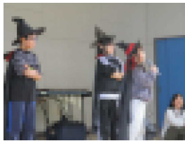
【3年生の「ありがとう」の様子】

また、6年生は小学校6年間でできるようになったことを実演しながら伝えてくれました。6年生が作り上げてきたよさを、在校生が引き継いでいくという思いを新たにしたい会となりました。