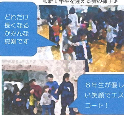
〈新1年生を迎える会の様子〉

【一年生を迎える会】 四月五日に入学した五十二名の新一年生を向陵っ子みんなで歓迎する会を十日(火)に行いました。六年生が一年生と手をつなぎ会場へ入場し、その後は全校児童で「じゃんけん列車」などのゲームを楽しみました。上級生が一年生にやさしく声をかけたり、他学年同士で積極的に関わり合ったりする活動を通して向陵っ子としての仲間意識が高まった時間でした。これからもいろいろな場面で異学年交流を図りながら楽しい学校生活を送って欲しいと願っています。