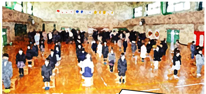
大変立派な態度で入学式に臨むことができた新1年生！

令和3年度は、44名の新1年生を迎えることができました。今年度も感染防止のために在校生が参加できず、式次第を省略し短時間で行うなどの対策が求められましたが、1年生とその保護者の皆様にとっては、一生に一度の小学校の入学式です。いろいろな制約はありましたが、できる限りの準備と配慮をしながら実施させていただきました。新入学児童の保護者及びご家族の皆様、おめでとうございます。