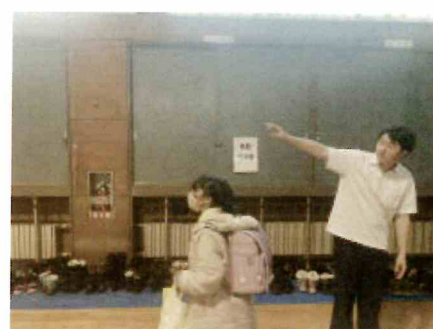
〈ゲーム形式の英語の授業〉 〈体育館では各小学校毎に待機〉 〈生徒会役員が誘導〉