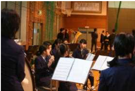
〈校歌演奏をする吹奏楽部〉

3学期は、自分の目標を明確にして、勉強や部活動で、目標を達成できるように、頑張っていきたいです。3学期は、2学期よりも短いけど、学ぶことがより多くなるようにしっかりと頑張っていきたいです。3学期を3年生につなげられるように、生活面や学習面などで、とても良いものにしたいです。