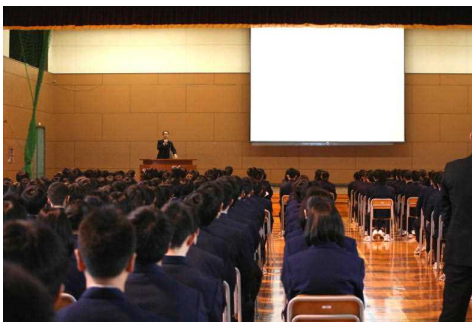
〈校長講話を静かに聞く様子〉

今のクラスともあと約2ヶ月でお別れです。より有意義に過ごして、良い思い出をもっと作り、2年生になったとき、良い後輩・先輩としていられるように頑張ります!!