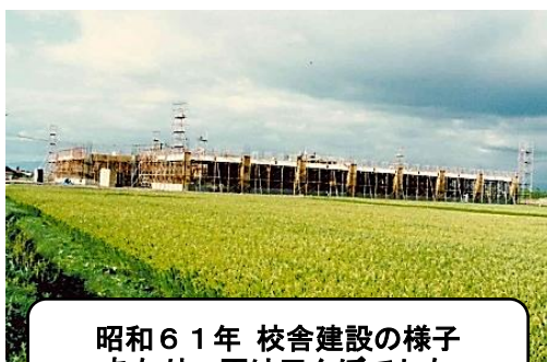
昭和61年 校舎建設の様子 あたり一面は田んぼでした

歴史を振り返ってみますと、昭和50年代後半の東光地区の宅地造成に伴う、旭川第三小学校の児童数の急増により、新たな学校が必要となったことから、共栄小は昭和62年に設置されました。以来38年が経ちましたが、今でも旭川市内で誕生した一番若い小学校として、歴史を着々と刻み続けています。開校当時は、集中暖房や各階の多目的スペース、明かりを採るための光庭、大きなスタンドグラスなど最新の設備やアイデアが盛り込まれ建設されました。以来、この3月までに2,266名の卒業生を送り出してきました。