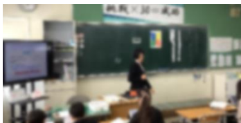
5年生国語「言葉でスケッチ」

物語に登場する人物の特徴について捉えたことを基に、相関図に整理して、端末を活用し交流して学びを深めました。