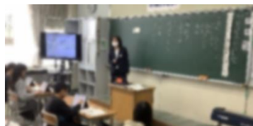
4年生国語「友情のかべ新聞」

12月12日(金)に、4年1組と5年1組で校内研修に関わる公開授業を行いました。4月より「主体的に深く考え、認め合う子供の育成」にむけた授業改善をテーマとし、「子供が主語となる学び」を目指してきました。また、緑が丘地区小中4校で取り組んでいる「リーディングDX」も同時に進めてきました。授業では、ICT端末を効果的に活用し、様々な選択場面を設定しながら子供たちが学びを実感できるように計画、実践しました。今後は更に深められるよう取り組んでいきます。