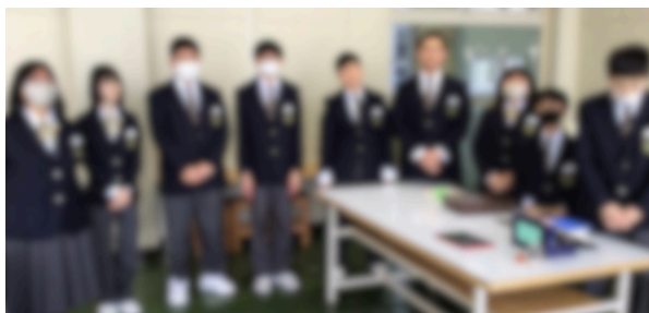
今年の販売実習も素晴らしい品物が多く、たくさん売れました。みんな頑張りました。