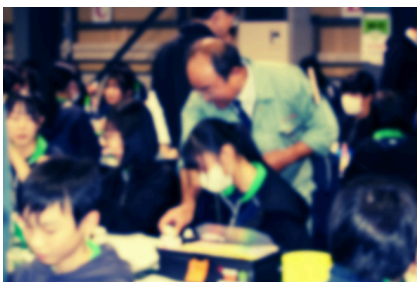
宿泊研修では、植松電機の社長さんから夢の大切さを学びました。

今後は、これまでの教育活動の成果と課題を真摯に分析し、次年度の活動がさらに充実したものとなるよう、検討を進めていきます。保護者や地域の皆様には、今後とも本校の教育活動への変わらぬご理解とご支援を賜りますよう、心よりお願い申し上げます。