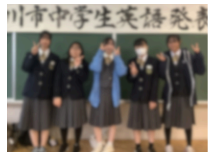
英語発表大会では、素晴らしい表情でスピーチをしていました。