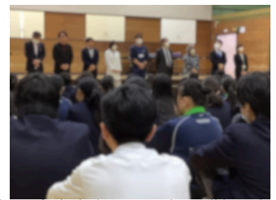
旭川市立大学から9名の講師を招き、職業講話を行いました。