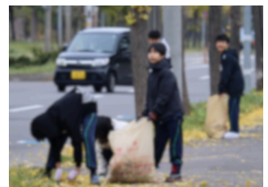
1年生は寒い中、元気に落ち葉拾いを行いました。PTA会長も褒めてました。