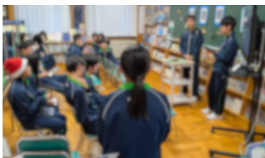
図書祭では、図書委員が自分たちで企画・運営を行っていました。