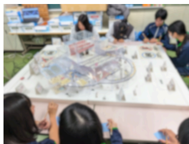
生徒会本部役員が、新しい市民文化会館に関するヒアリングを依頼され、たくさんの意見を述べていました。