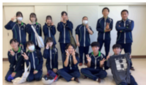
今年はじめて地域ボランティアに参加し、たくさんの方々と交流しました。