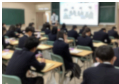
実業高校へ体験学習に行きました。キャリア教育の一環です。