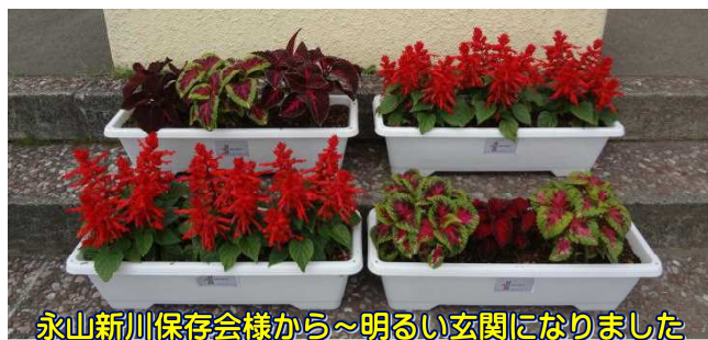
永山新川保存会様から～明るい玄関になりました

今年度の「学校いじめ防止基本方針」をホームページにアップしています。この基本方針にのっとりながらいじめの未然防止に努めてまいります。保護者の皆様のご理解とご協力をお願い申し上げます。