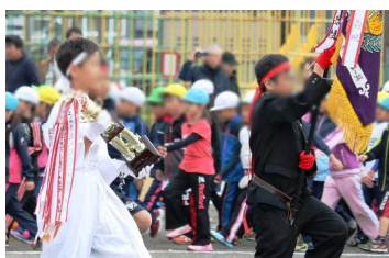
応援団長を先頭に入場！

運動会で一歩成長した子どもたちが更にステップアップできるよう全校一丸となって指導していきます。今後とも、本校の教育活動の推進にご理解とご協力をよろしくお願い致します。