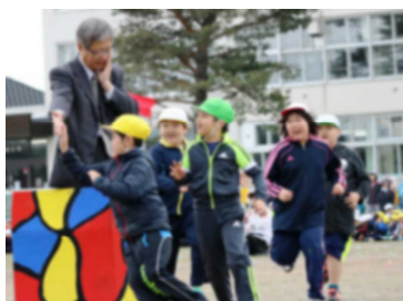
1年 今日のラッキーカラーは?