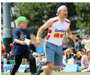
3年 KSK (カードの指令で駆け回れ)