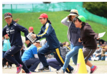
6年 レンタル救世主!!