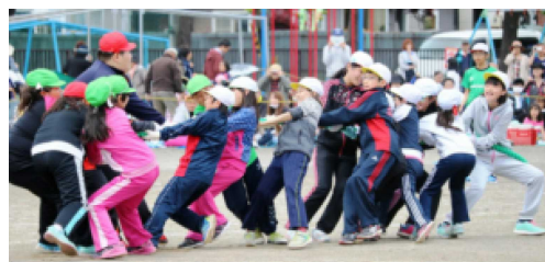
5年 ヒッパレ ひっぱれ