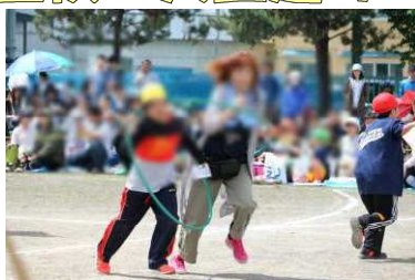
4年 つないで☆つないで