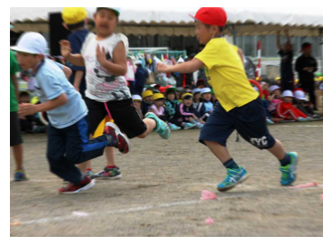
低学年 選手リレー