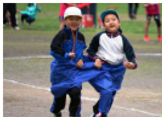
2年 ぐんぐんすすめ!