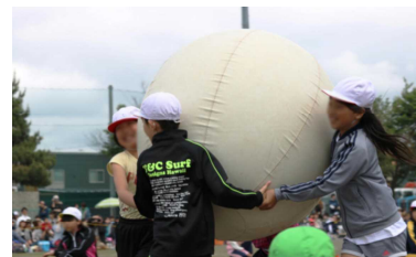
3年 イエ～イ! 元気玉!