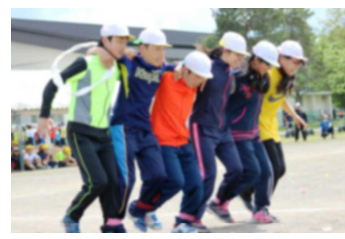
6年 結びで 結びで