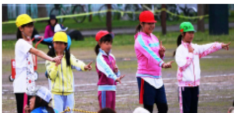
5年 dancing up!