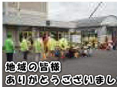
地域の皆様 ありがとうございました