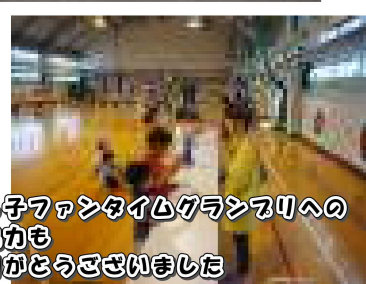
西っ子ファンタイムクラブへの 御協力も ありがとうございました