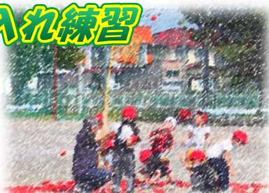
2年生 大玉リレー練習