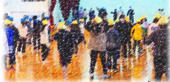
5・6年生 西っ子ソーラン練習

明日5月27日(土)は第72回運動会 現在使っているグラウンドでの最後の運動会です!