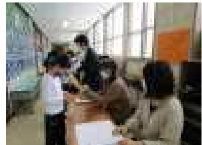
25日に観覧席のくじを実施