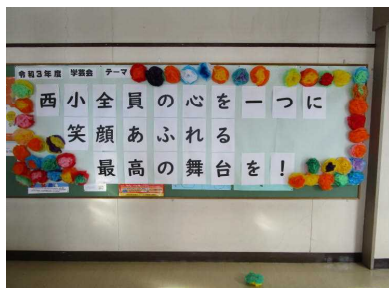
児童会によるテーマ飾り