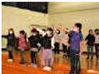
本番に向けて力が入ります！