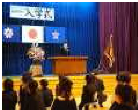
お話もしっかり聞けました