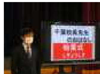
千葉校長先生のお話