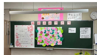
すてきな黒板がお出迎え！