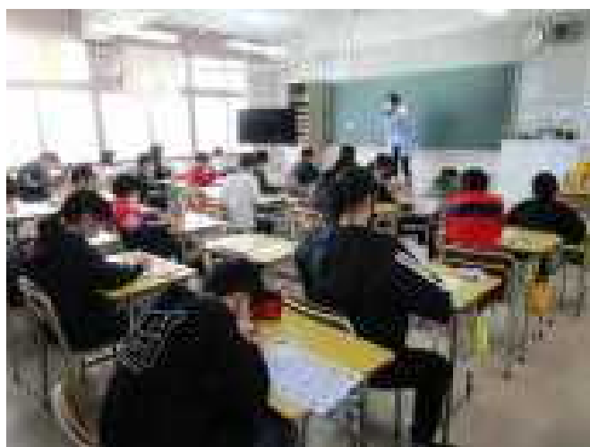
もちろん勉強にも一生懸命です 4/19実施の全国学力・学習状況調査も頑 張りました！