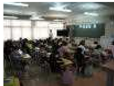
どの子も集中しています！

放課後には学級懇談も実施されました。ご参加ありがとうございました。5月には運動会も実施される予定です。今後とも学校行事等へのご協力をお願いいたします。