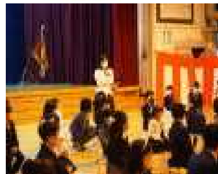
立派に「はい」と返事ができました