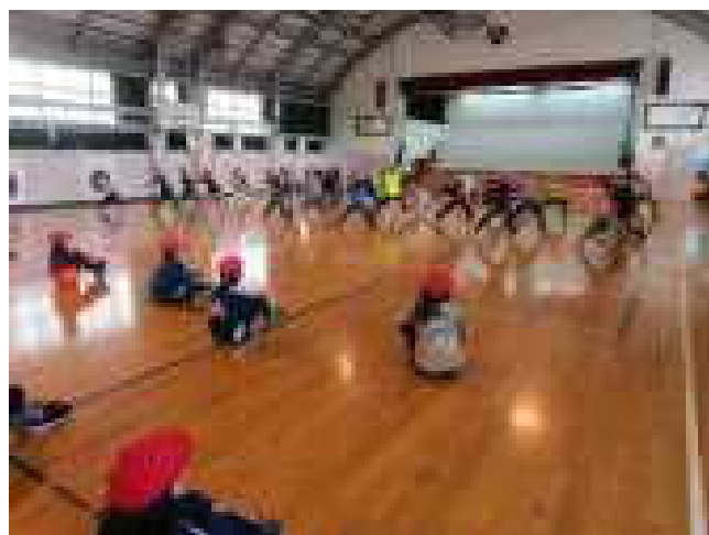
運動会に向けて伝統の「西っ子ソーラン」練 習風景 5年生にお手本として見せています