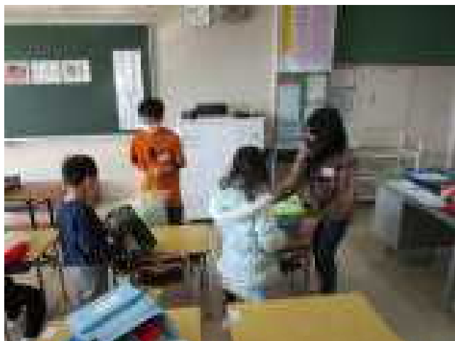
新1年生の朝のお世話や給食の片付けなどを毎日 お手伝いしています