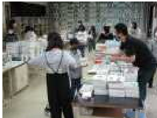
4/6の前日登校日 入学式の会場 設営や教科書運びなどを頑張りました